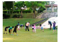
いこバでの体操の様子

子ども達は、宜野湾小学校の運動場、まっぼっくり公園や中原公民館、いこバ、自宅近くの広場等でラジオ体操に参加していました。