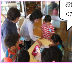
お名前、教えてください