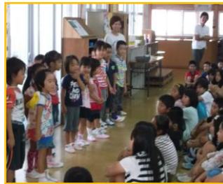
【幼稚園代表の子が5年生の学年朝会であいさつをしました】