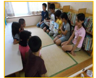
【お互いまだ、緊張の中での読み聞かせ 今後、どれだけ近づけるか楽しみです】

9月19日（木）から、宜野湾小学校5年生が、絵本の読み聞かせに幼稚園に来てくれています。